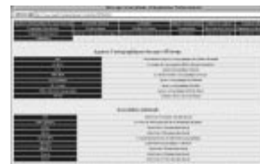
Extrait rubrique annuaire des sociétés