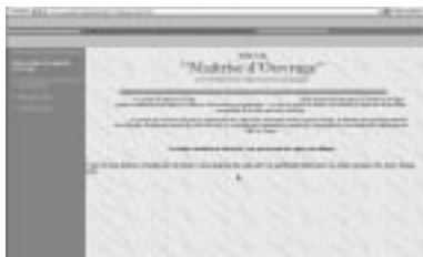
Page d'accueil des fiches techniques

fiche réalisée par le groupe de travail avec l'aide du Secrétariat général du CNIG